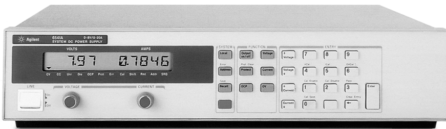
6600 系列高性能系统电源